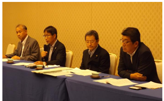
▲ 政策懇談会の様子