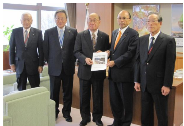
▲国土交通省 根本幸則国土交通大臣政務官への要望活動