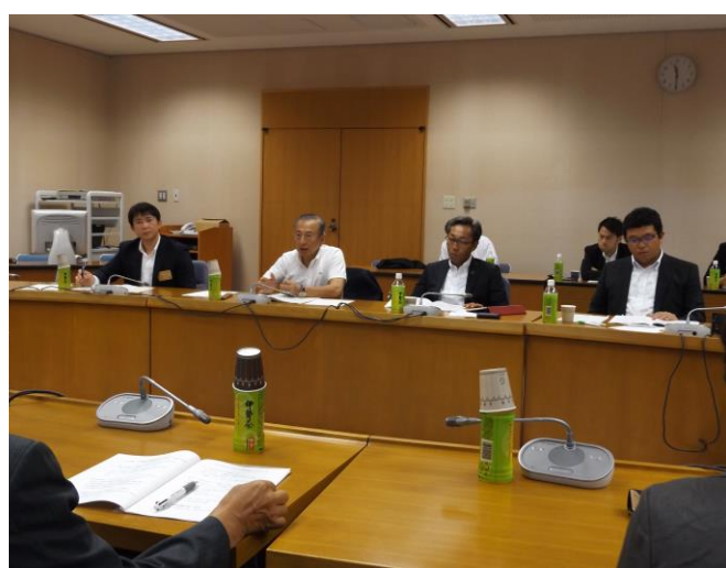
▲団体懇談会の様子